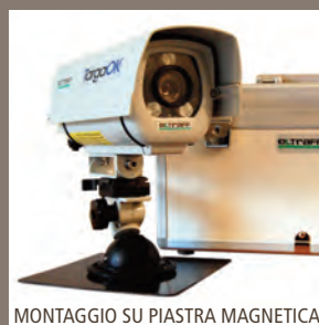
MONTAGGIO SU PIASTRA MAGNETICA